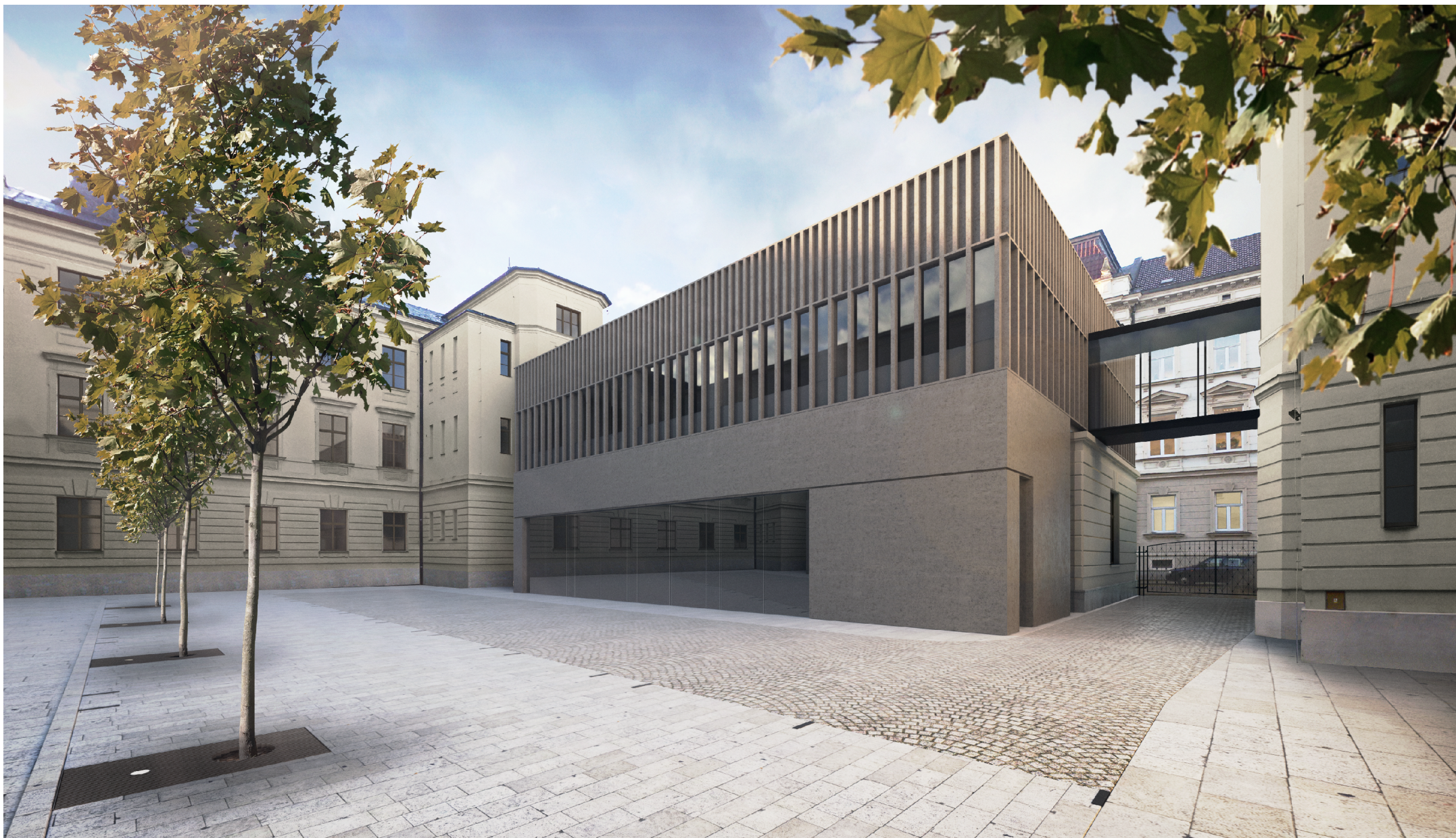
VIZUALIZACE - POHLED Z NÁDVOŘÍ