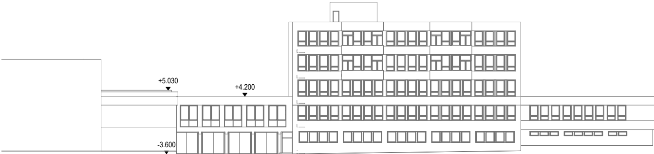
POHLED - SOUČASNÝ STAV M 1 : 500