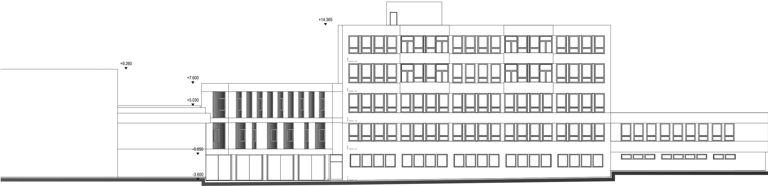
POHLED - NAVRŽENÝ STAV