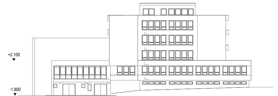
POHLED - SOUČASNÝ STAV M 1 : 500