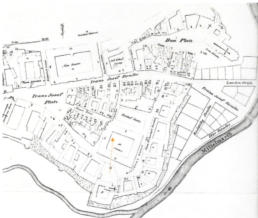
19. století – Olomouc Natherova kniha olomouckých domů (šipka definuje sledovaný objekt)