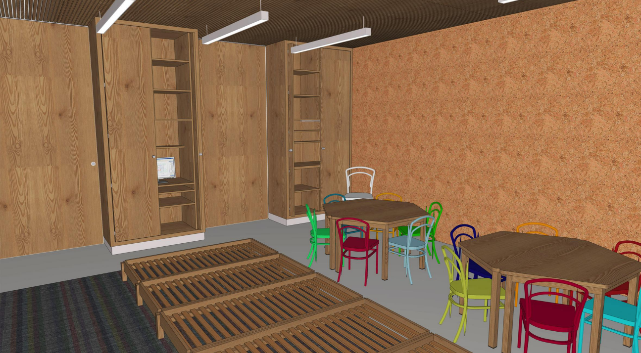
1.11 PE 1