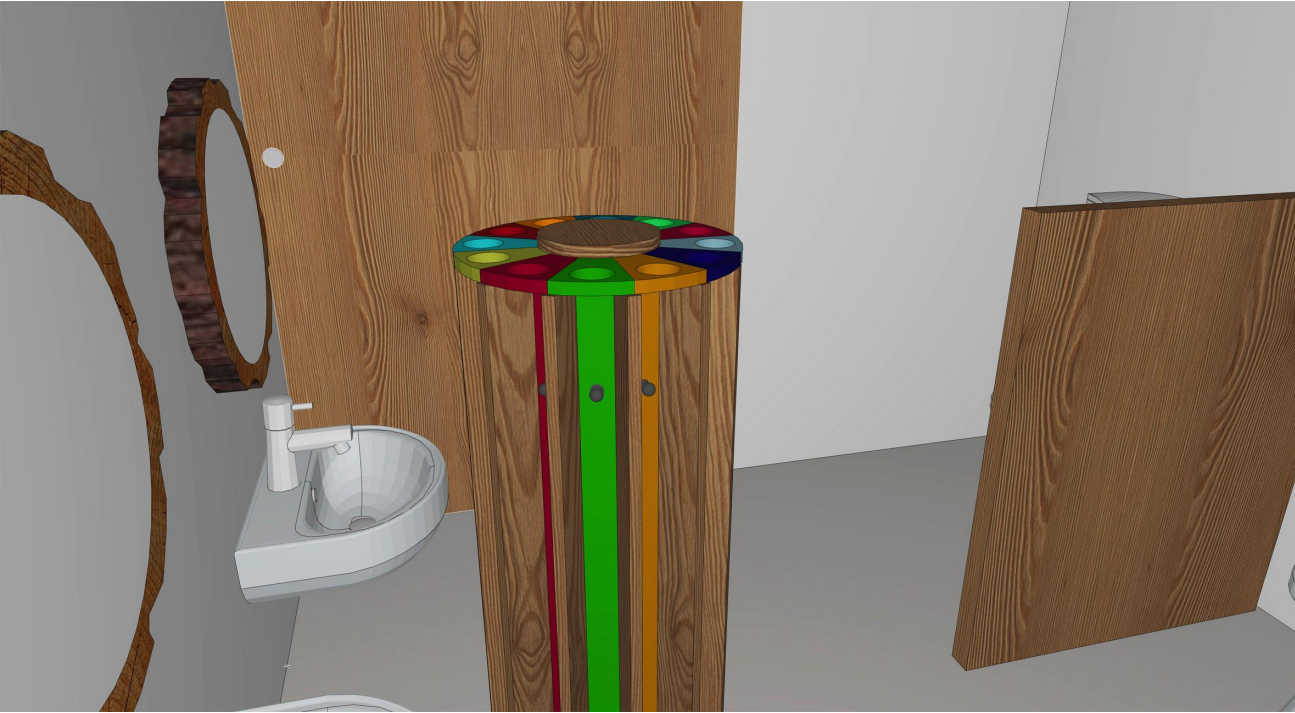
1.14a pe 2