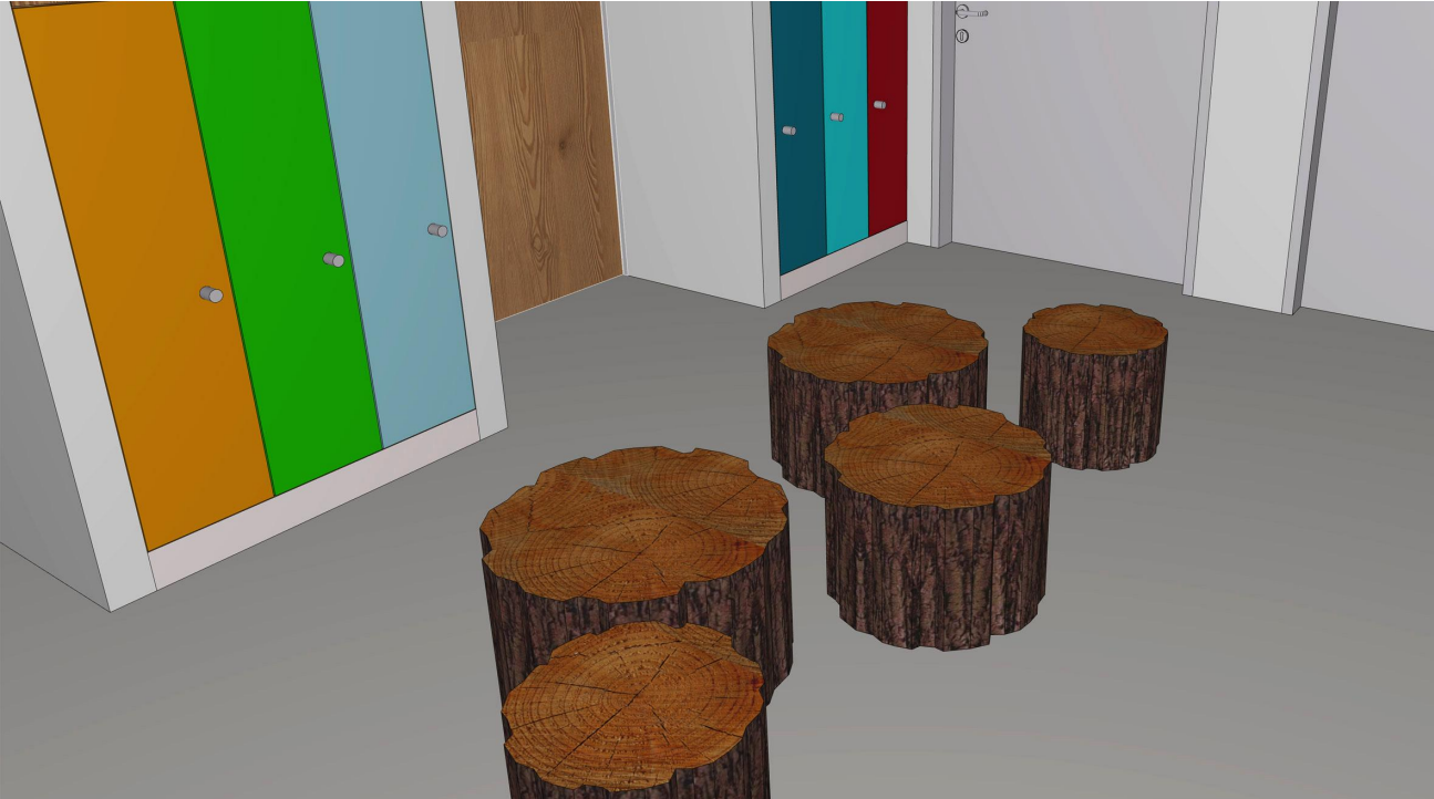
1.14 PE 2