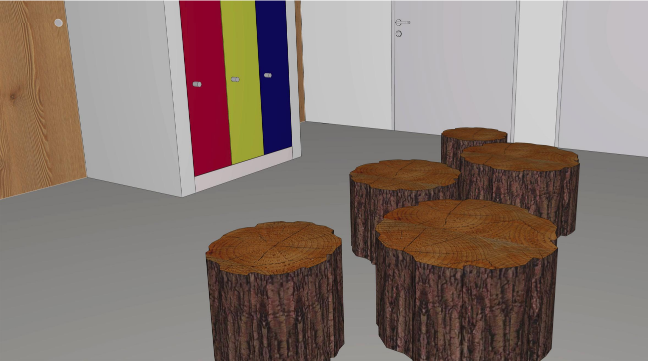
1.14 PE 1