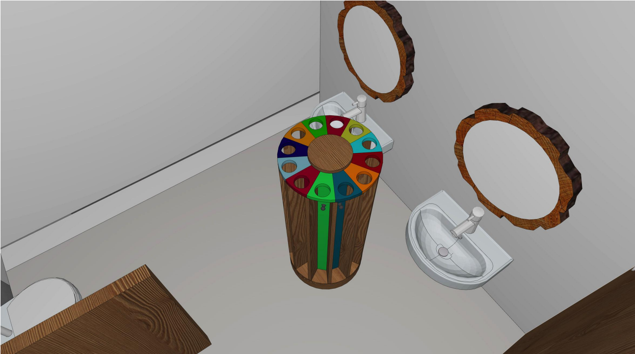
1.14a PE 1