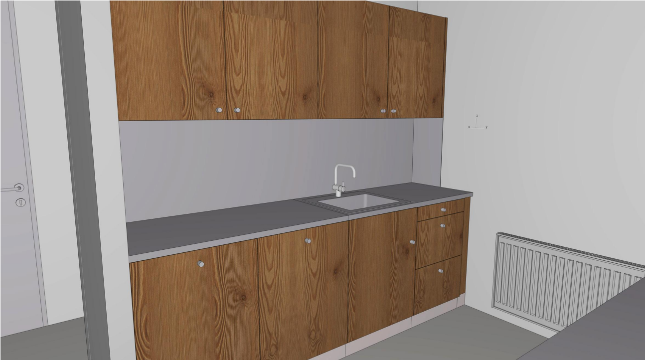
1.12 PE 2