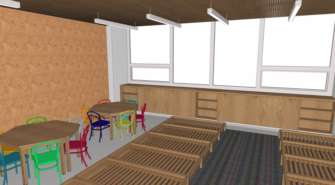
1.11 PE 2